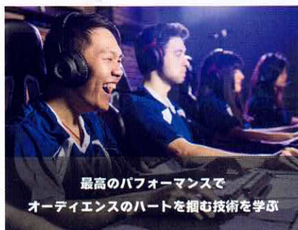
最高のパフォーマンスで オーディエンスのハートを掴む技術を学ぶ