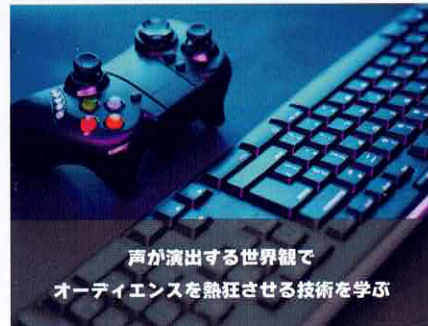
声が出せる世界観で オーディエンスを熱狂させる技術を学ぶ

▶ 定期的開催される ONEGAME 大会のイベント設営、運営チームとして活躍できる。