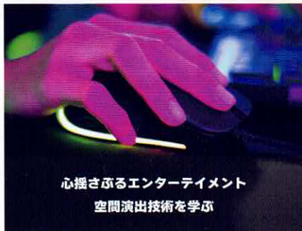
心揺さぶるエンターテインメント 空間演出技術を学ぶ

▶ ONEGAME システムにより、自身の実力が可視化されることで次の目標設定を明確にし、自身のプレイ技術の向上を図る。