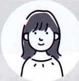
利用者 Eさん 20代 女性

障がいを抱えており、eスポーツとは無縁でしたが今回この様な事業所が誕生したと聞き実際に通ってみたら本格的な設備でびっくり致しました。みんなも同じ障がいを抱えている人で共通な趣味もありチームであり家族でもある空間が好きです。