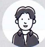
利用者 Nさん 40代 男性

自分は元々声を出しづらく言葉が詰まってしまうことが多々ありました。しかしこのコースに通うことによって発声や滑舌などを学び、自分がこんなに大きな声で喋れる様になると思っていなくて自分でもびっくりしました。