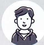
利用者 Uさん 20代 男性

障がいを抱えており、eスポーツとは無縁でしたが今回この様な事業所が誕生したと聞き実際に通ってみたら本格的な設備でびっくり致しました。みんなも同じ障がいを抱えている人で共通な趣味もありチームであり家族でもある空間が好きです。